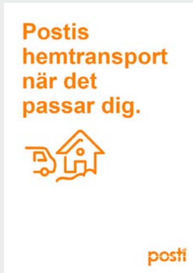
ANNONS OM HEMLEVERANS 105 x 148 mm

Annonsens storlek är riktgivande. Vid behov kan du byta ut texterna.