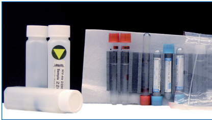
Kuva 2. Sekundaaripakkaus voi olla myös tiivistä suljettava muovipussi.